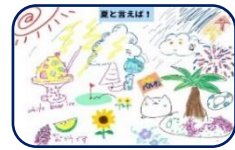
ロイノートで共同絵画