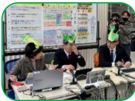
相次いだ取材や視察