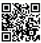
フレンドリー オンラインHP

今年度の配信は3月15日(金)で終了しますが、3月末まで「すらら」や「ライフイステックリッスン」、「インスパイアハイ」などの学習コンテンツは使用できます。それぞれのペースで学び続けてください。また、今後の予定などは順次フレンドリーオンラインのホームページにアップしていきます。よろしければ、たまにチェックしてみてください。