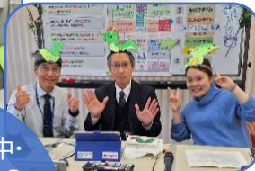
芳野・河内中・ 教育委員会の 先生たちとの 数々の 楽しい学習