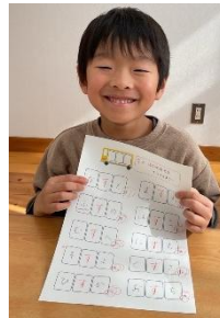
ス音の前後に音をつけても、ス音がきれいに言えるようになりました！