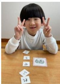
練習している音が、100回言えたよー！の瞬間です！