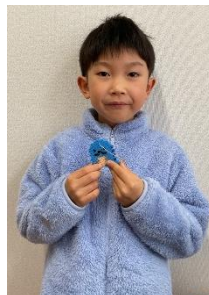
アイロンビーズでキーホルダーを作りました。ビーズを1つずつ丁寧に組み合わせました！