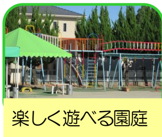
楽しく遊べる園庭